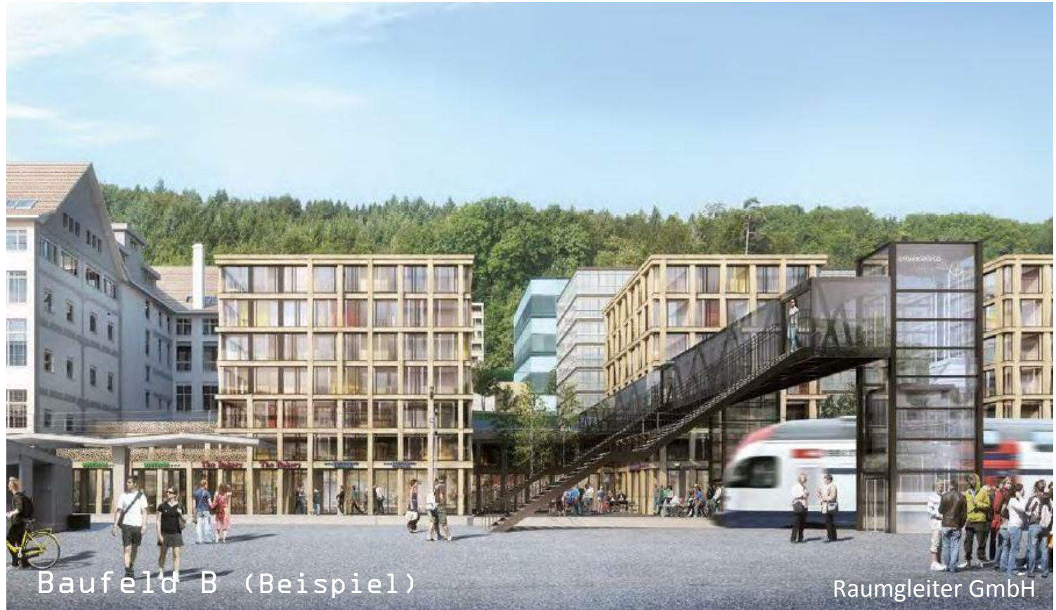
Baufeld B (Beispiel)