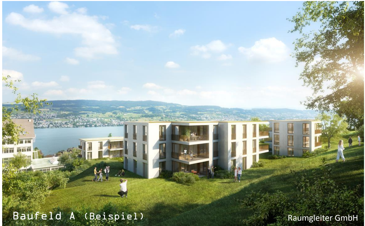
Baufeld A (Beispiel)